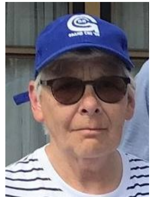
DE GOUDEN GREEP

De doublettenpartijen starten in dezelfde samenstelling als in de eerste ronde.