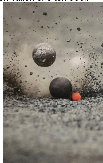
Met deze foto is de bestuurskamer compleet gemaakt

De werkzaamheden worden gepland na het voorjaar 2024.