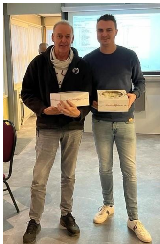
1 ste prijs