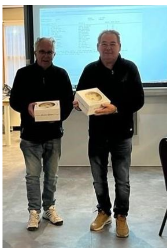
2 de prijs