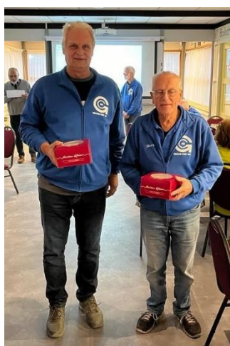
3 de prijs