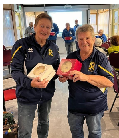
3 de prijs